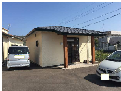
地域交流施設 むつごろう