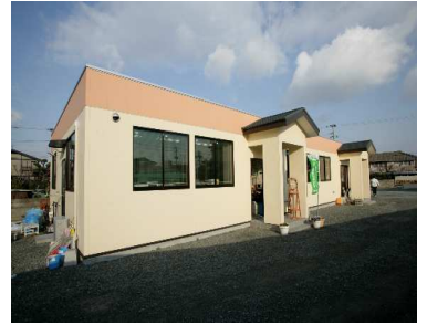
↑事務所全景(高砂町)